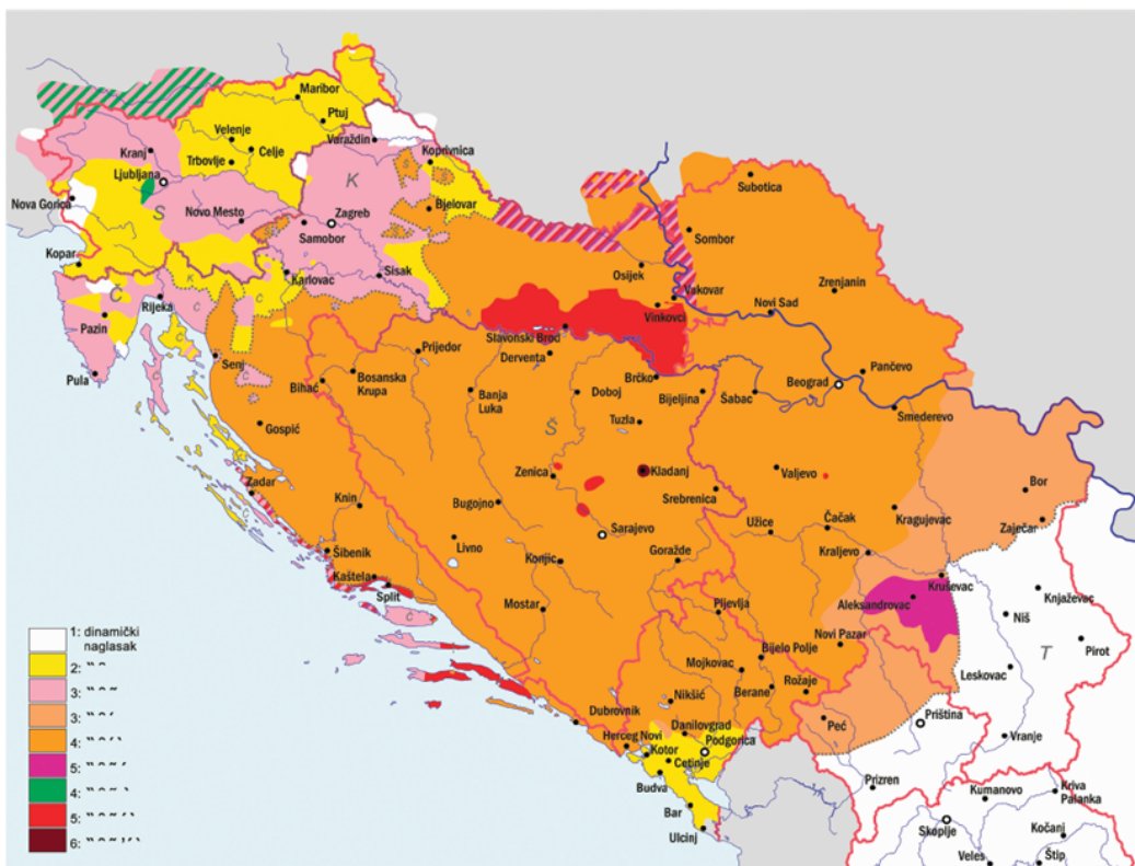
Broj naglasaka u dijalektima